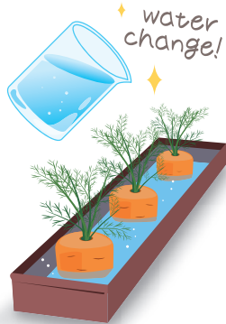
にんじんのヘタの水は毎日替えましょう

もっと気軽に、ということなら、土のいらぬ植物・エアープランツをいくつか小皿に乗せてダイニングなどに飾るのはいかが？エアープランツは時々陽に当て、乾燥したら涼しい時間帯に時々霧吹きで水をあげるだけと手入れが比較的簡単。側にお茶用のお砂糖などを小さいタンブ