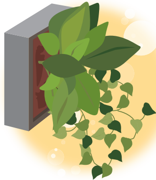
水やりも、壁掛けの状態のままできるものがポピュラーです♪

ングラータといった人気の植物が寄せ植えされた状態なので、すぐ飾ることが出来ます。