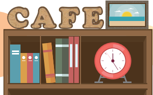
100円ショップでも手に入るアルファベットの木製オブジェを並べてもステキ♪

パートメントのようなビンテージ感を演出した「ブルックリンスタイル」も人気です。レング調の壁紙を使ったり、英文が書かれた雑貨をアクセ