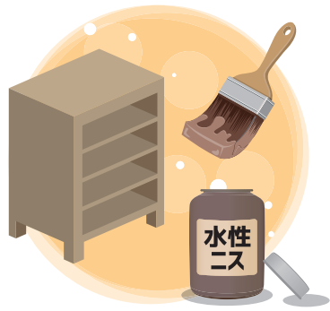
棚は水性ニス塗装してもアンティーク感が出ます。

塗っていきます。もし、ワックスなどで仕上げられていたら、サンドペーパーで軽くこすり、落としから塗るとキレイに塗ることが出来ます。また、ハケでなく、スポンジやポロ布に塗料を含ませてたたくように塗ると味わいのある雰囲気になります。